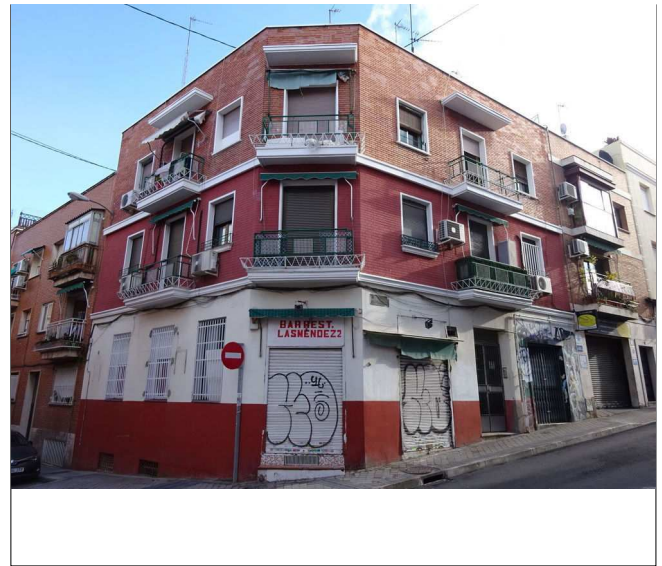
Fotografía del inmueble